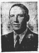
Canciller Bramuglia de los "Derechos del Trabajador" en la celebración del Congreso Panamericano de los Derechos de

BUENOS AIRES. 8. — El Canciller Bramuglia refirió a los periodistas a los que hizo una exposición de la actuación de la Delegación Argentina en la IX Conferencia Panamericana celebrada últimamente en Bogotá, afirmando que se ha logrado el objetivo principal: estrechar la unidad de los países del Continente bajo la buena dirección, y con la voluntad, la colaboración en lo económico y hábilmente firme su libertad económica y política.