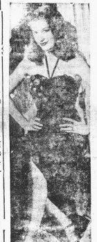
Bárbara Bates, descubrimiento de Frank Capra y que debutará en próximas películas