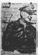
General Mac Arthur

WASHINGTON, Junio 1.º — Llegó por vía aérea el General Mac Arthur al cuartel llamado por la Comisión de Relaciones Exteriores de la Cámara de Representantes para que comparezca.