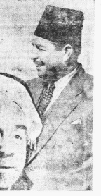
Talal es hijo del rey Abdullah (Talal) y ante los recientes acontecimientos en Palestina ha dispuesto la nueva Constitución de Israel conjuntamente con Jordania. El príncipe con la decisión de la L. Árabe.