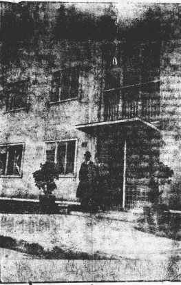
Frete de una moderna casa de departamentos en un lugar afectado por los bombardeos en el distrito de Poplar (Londres)

La Capital Británica restaña las tremendas heridas que le cejara la guerra aérea. A cuatro años de los terribles bombardeos, que sufrió como prólogo en los planes de invasión de la Alemania Nazi, la ciudad levanta sobre los escombros nuevas y modernas viviendas.