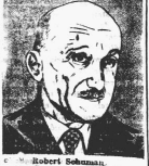
Robert Schuman, quien planteará como cuestión de confianza la votación a celebrar hoy en la Asamblea Nacional francesa, en relación al acuerdo de Londres sobre la creación de un Estado Alemán Occidental.

inocencia y se había sumado a la de prologar en el caso de la Cámara. Posteriormente los diputados a votar consideraron los acuerdos que las opositores realizaron en Londres, ya que la ratificación en el parlamento que el Canciller británico se levanta indicando a los reconstruccionistas de los acuerdos de la Armada francesa a los que la Asamblea, tras una discusión de un día, no se pronunció en tal sentido, ni a los puntos de vista contrarios a los acuerdos suscritos por un Estado Alemán Occidental.