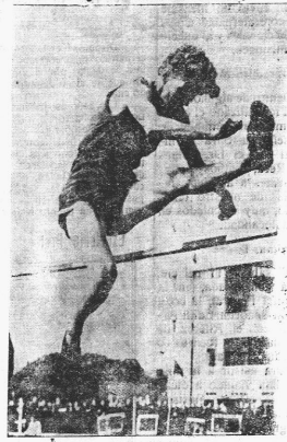
La Sra. Dorothy Odam de Tyler, que ganó el campeonato femenino británico de salto en alto, con una marca de 5 pies y 4 pulgadas.

A los 18 años de edad, se clasificó segunda en los Olímpicos de 1936