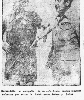
Bernadotte en compañía de un jefe Arco, realiza lentos esfuerzos por evitar la lucha entre árabes y judíos.

ESTOCOLMO, 21 — Una gran multitud se reunió en la plaza para recibir los restos del Conde Bernadotte, que fueron traídos desde Estocolmo.