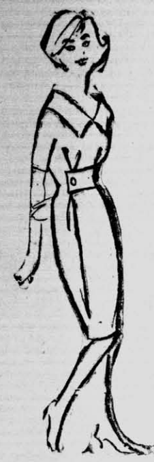
PLIEGUES profundos, dan flojedad al busto y cadera.

Creaciones YAYA AYACUCHO 347 Teléfono 1278 PRESENTA: Diseños de la Moda