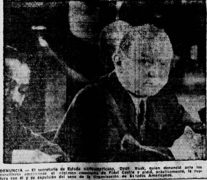
DENUNCIÓ - El secretario de Estado norteamericano, Dean Rusk, quien denunció ante los cancilleres americanos el régimen comunista de Fidel Castro y pidió, prácticamente, la ruptura con él y su expulsión del seno de la Organización de Estados Americanos.