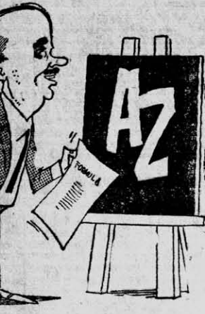
ACUNA — Yo creo que esto camina y voy confiado a la meta... ¡Pues le puse vitaminas de la "A" hasta la "Z"!

TEHERAN, 5 (UPI) — Una fábrica de cohetes de esta ciudad estalló anoche, causando la muerte a 17 personas y dejando a otras 10 heridas de gravedad. La policía dijo que la explosión destruyó cinco casas. Una gran cantidad de pólvora y alrededor de 100 mil cohetes hicieron explosión, según las autoridades. Se agregó que la explosión ocurrió en el sótano de una casa en que se confeccionaban cohetes para festejar el año nuevo iraní, el 21 del presente.