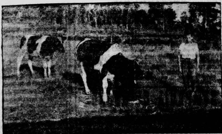
Ministerio de Asuntos Agrarios