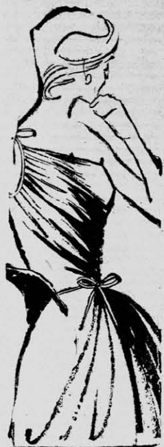
RULOTTE en un hombre y cintura, pliegues al bias