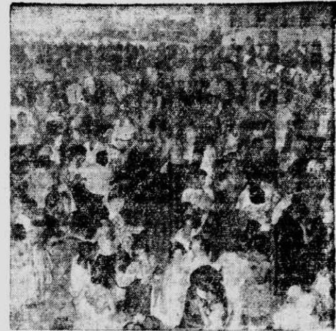
RITMO brasileño hubo en la mayoría de los bailes de Carnaval. En el grabado, un instante de la reunión danzante ofrecida por el Club Atlético Posadas...