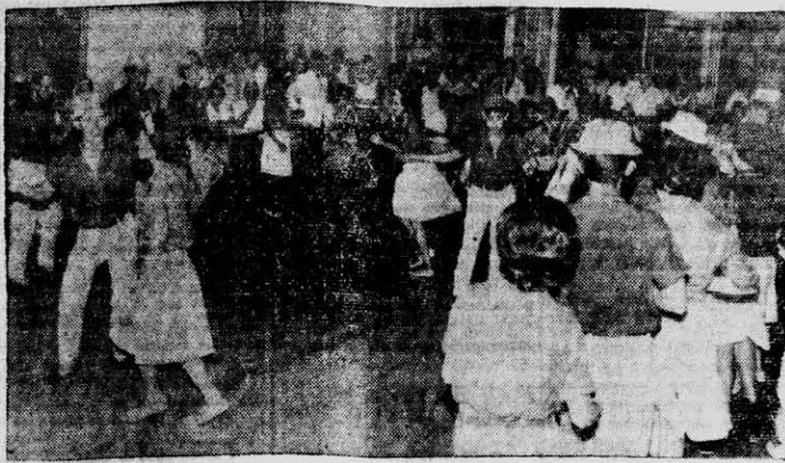
ALEGRIA y buen humor en el Club del Progreso. En la nota gráfica, aparecen los integrantes de la comparsa que dicha institución presentó para celebrar el carnaval 1962.