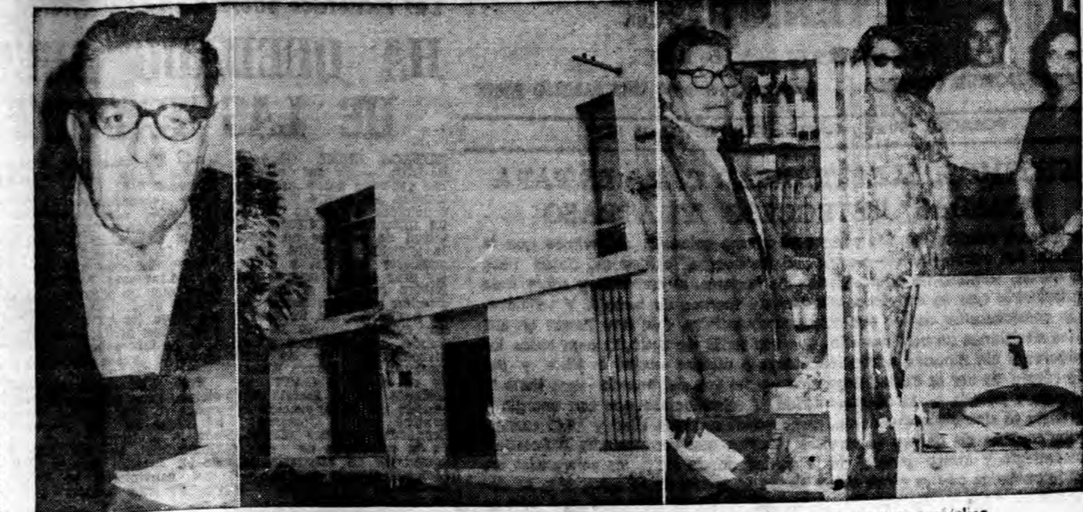
JUBILADOS: el presidente, su casa y una sala de primeros auxilios incompleta, no cuenta con médico.