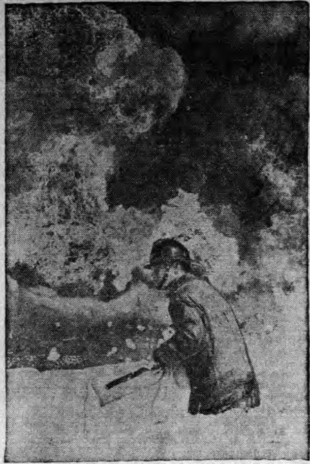
BOMBERO VIRA SU CABEZA del intenso calor de unas llamas que arrojan un camión-tanque destruido des pués del choque del camión y un automóvil en Bell flower. El está parado en medio del fuego combatiéndolo. Una persona murió.