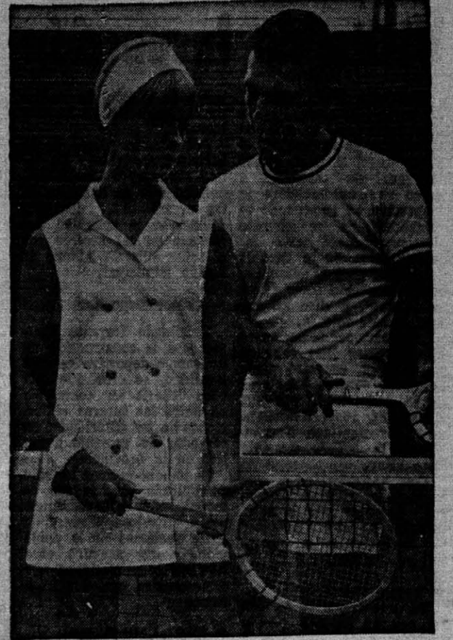
Brevísimo delantal, sin mangas y con cuello chemisier en algodón blanco, con detalle de doble abotonadura al frente.

Cómo podían practicar también las mujeres de 1900, con faldas que rozaban casi el piso, corset y puntillas hasta el cuello y las muñecas, es realmente un misterio. Hasta sombreros usaban, con la única concepción de zapatillas. Susana Lenglen, luego de la Segunda Guerra Mundial, introdujo junto con su fama la moda del traje de tenis sin mangas y hasta la rodilla. Le siguió en avances Helen Willis, eximia tenista, y Alicia Marble que implantó los pantalones cortos. Por fin Gussie Moran ganó el Wimbledon luciendo shorts. A partir de ese momento la brevedad del atuendo de tenis se implantó, tal como el color blanco viene que no puede derrocar ningún otro tono. Las telas usadas en forma invariable son lavables y el corte sencillo y coqueto, facilitando en todos los casos el movimiento.