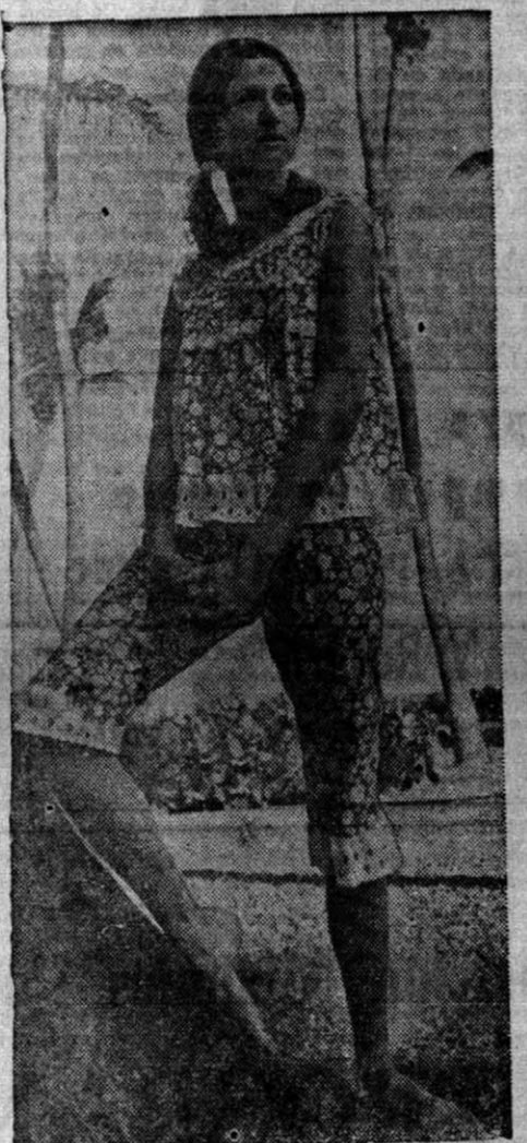
Pijama en tela imprimé de motivos florales con adornos de encajes.