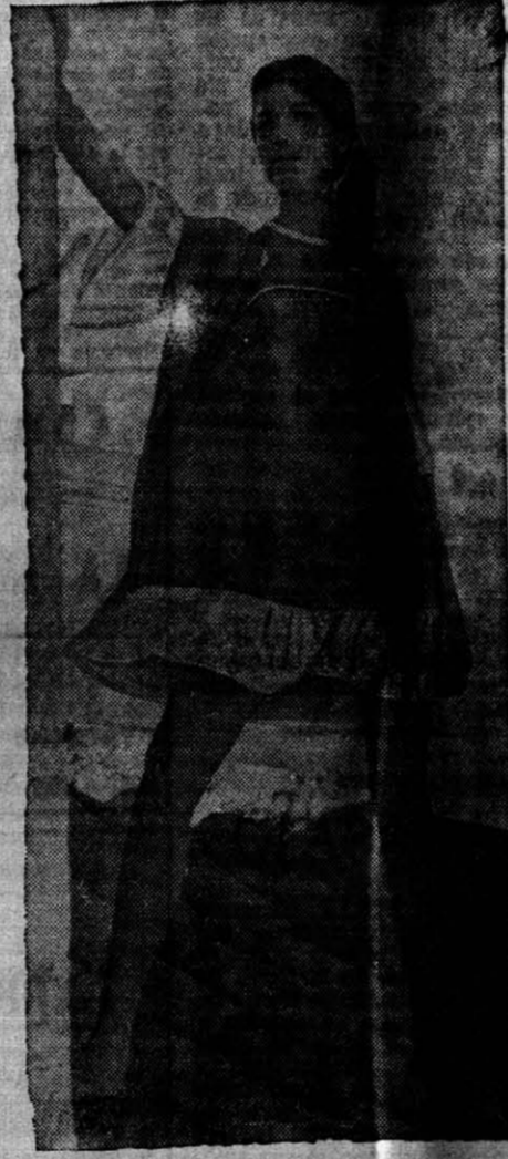
Camisones en tela imitación batista, con adornos de margaritas y encaje. Se ofrecen en tres largos distintos con saldos de cama haciendo juego.